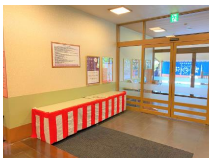
玄関中出店スペース