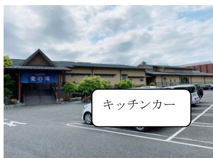
キッチンカースペース